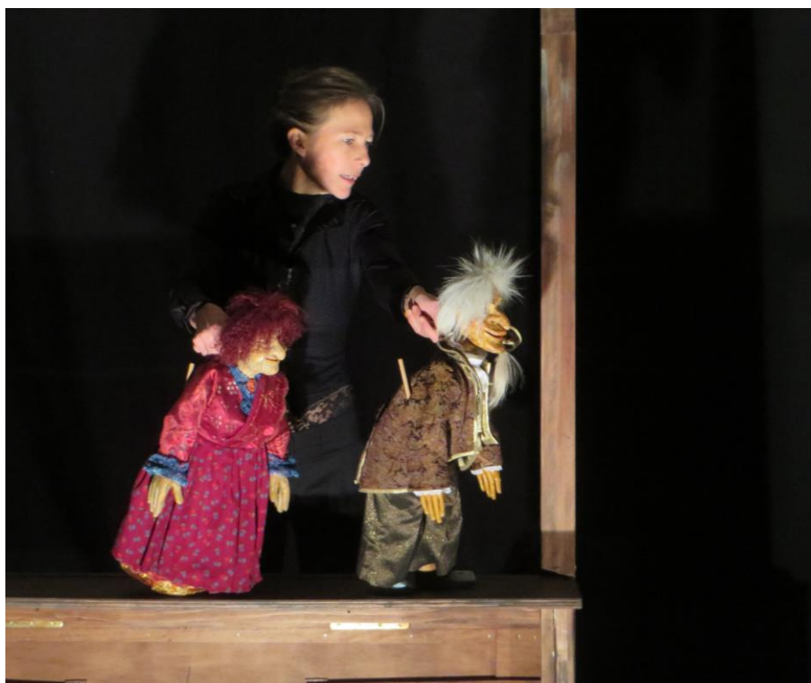
Photo de répétition